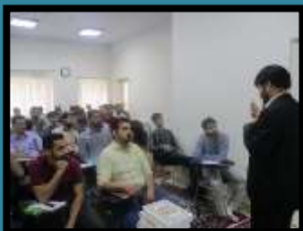
ترم اول تدبیر