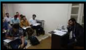
آموزش زبان وحی