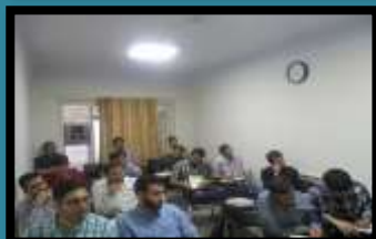
ترم دوم تدبیر