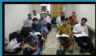
مبانی تدبیر در قرآن