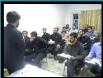
ترم سوم تدبیر