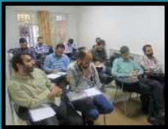
میان‌ی تدبیر در قرآن