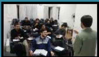
دوره مهارتی - گفتمانی ۲