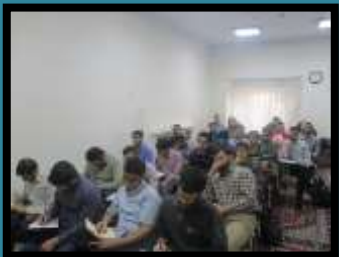
ترم اول تدبیر