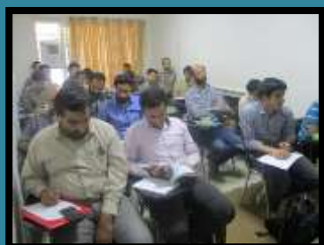
آموزش زبان وحی