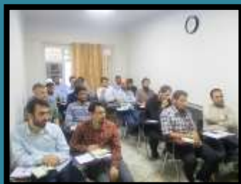
ترم سوم تدبیر