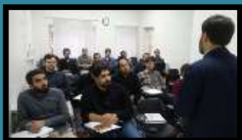
دوره مهارتی - گفتمانی ۱