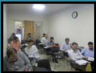
آموزش زبان وحی