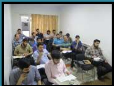
ترم دوم تدبیر