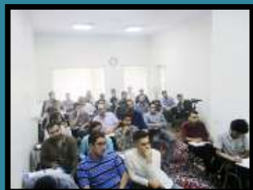
ترم اول تدبیر