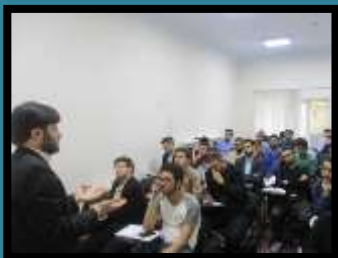
ترم دوم تدبیر